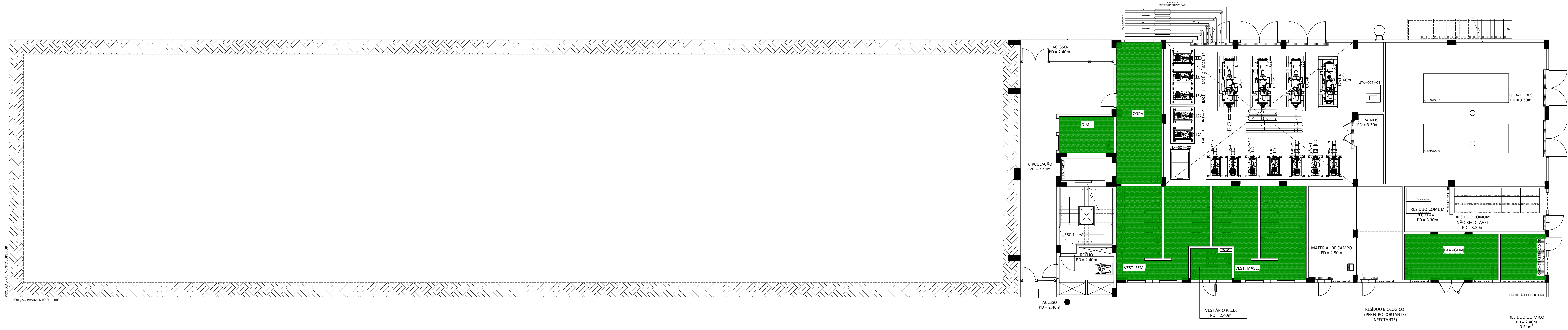
1 PLANTA BAIXA_PAVIMENTO TÉRREO ESCALA 1/100